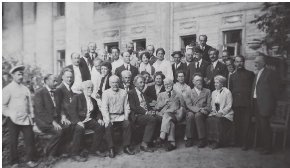
Группа отдыхающих Санатория «Узкое» ЦЕКУБУ, 1922 г. АРАН. Ф. 311. От. 1а. Д. 121. Л. 79.

«Республика Санузия» («Санта-Узкое») — «Республика ученых»