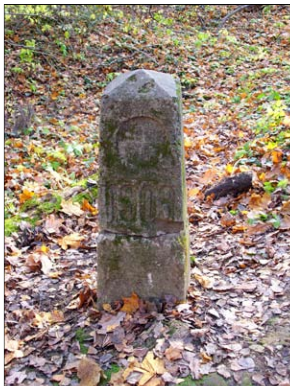
Межевой столб 1909 года

Пока все подобные обелиски (на данный момент их, помимо столба в Битцевском лесу, нами найдено семь: два в Царицыне, три в Ромашковском лесу к западу от Москвы, Кунцевом, один частично сохранившийся в Крылатском и один неподалеку от