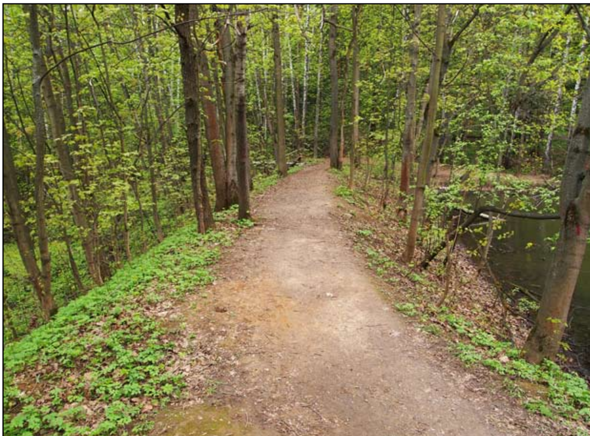
Дамба между Севастопольскими (Козмодемьянскими) прудами

При ближайшем рассмотрении оказывается, что рядом находится и второй пруд (спущен), то есть в Козмодемьянском в XVIII веке было два пруда, соединенных каналами. Конечно, правильное их именовать опять же не Севастопольскими, а Козмодемьянскими — по аналогии с другими московскими и подмосковными усадебными прудами.