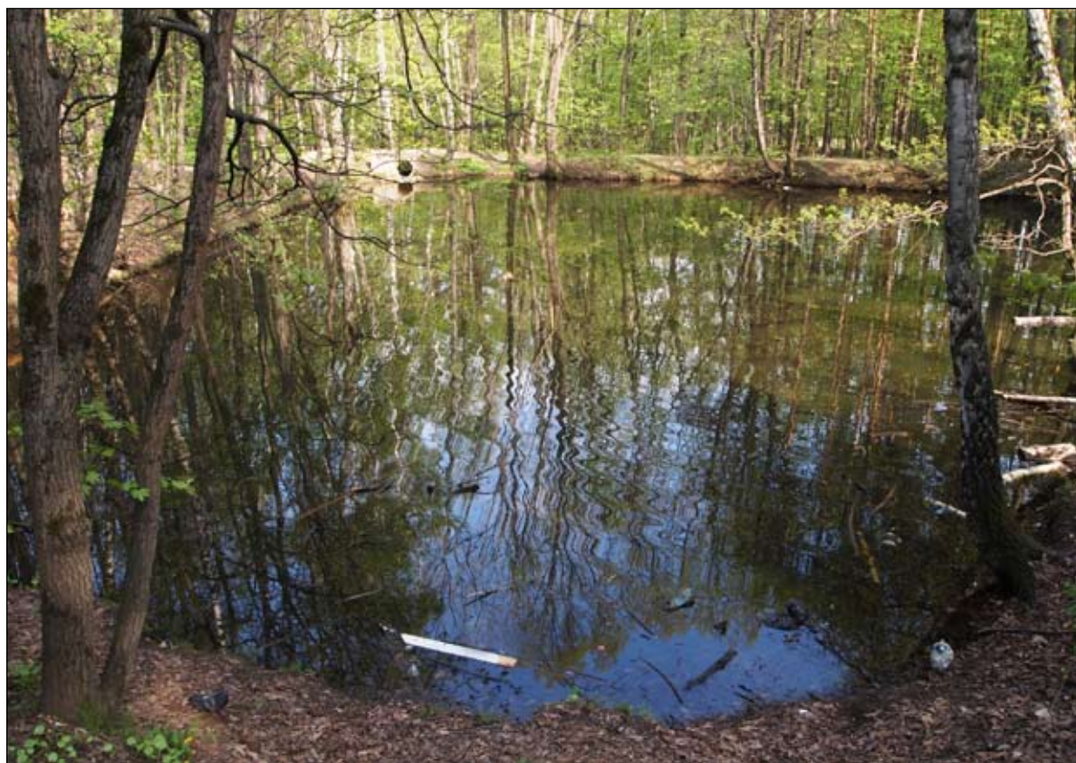
Второй пруд в усадьбе Марково

Последний марковский пруд носит название Липняк, так как он обсажен липами. Не исключено, что первоначально на его месте было два пруда.