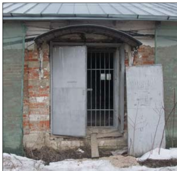
Пилястра конюшни с чередованием белого камня и кирпича

литературе и списках памятников, находящихся на государственной охране, ошибочно числится «домом причта». Анализ архивных документов показал: такового в Ясеневе никогда не было. Служители и священники жили в отдельных деревянных домах. Кстати, один из них, бывший дом дьякона, оказавшийся свободным после упразднения дьяконской вакансии в Ясеневе, в начале 1870-х годов купил Вадим Семенович Раич (1836–1907) — владелец фотографического заведения в Денежном переулке. В экспликации к плану Ясенева 1901 года загадочный «дом причта» обозначен следующим образом: «Людские комнаты конного двора», то есть жилье для конюхов и кучеров 26 , что совершенно логично. К сожалению, сооружение современной ограды подворья отодвигает перспективу восстановления конного двора как самостоятельного комплекса в далекое будущее.