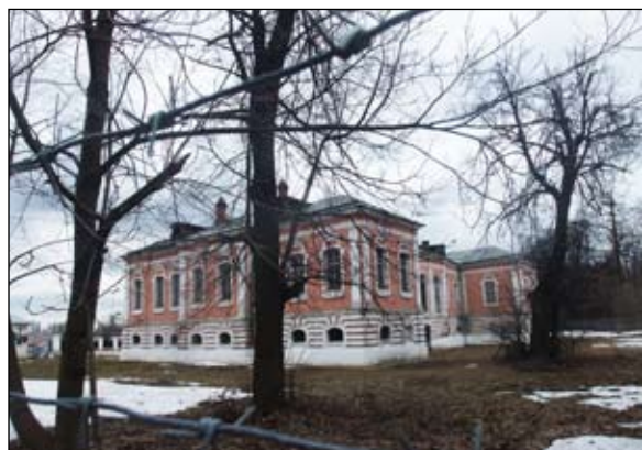
Усадебный дом в Ясеневе