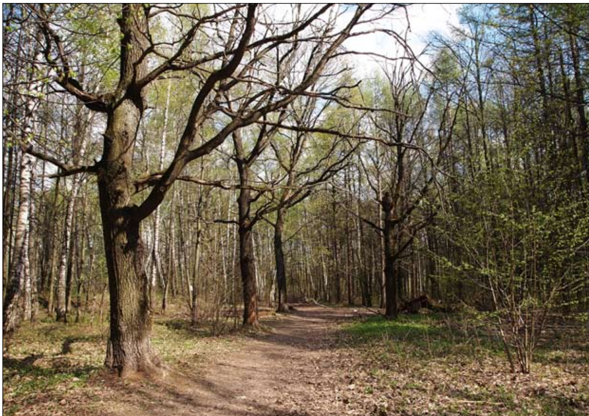
Дубовая аллея на территории усадьбы Бирюлево

Парк усадьбы пребывает в относительно приличной сохранности и состоит из остатков дубовых аллей примерно 150-летней давности. Тогда Бирюлево принадлежало князьям Оболенским 12 . Шаг — расстояние