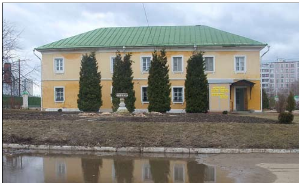
«Людские комнаты конного двора» — здание, принадлежащее подворью Оптиной пустыни и ошибочно называемое «домом причта»