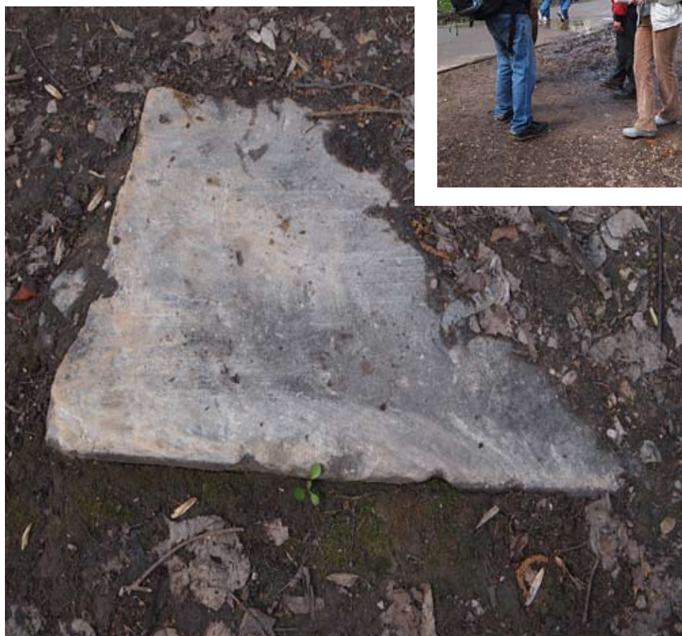
Ступень от лестницы, обнаруженная на берегу пруда