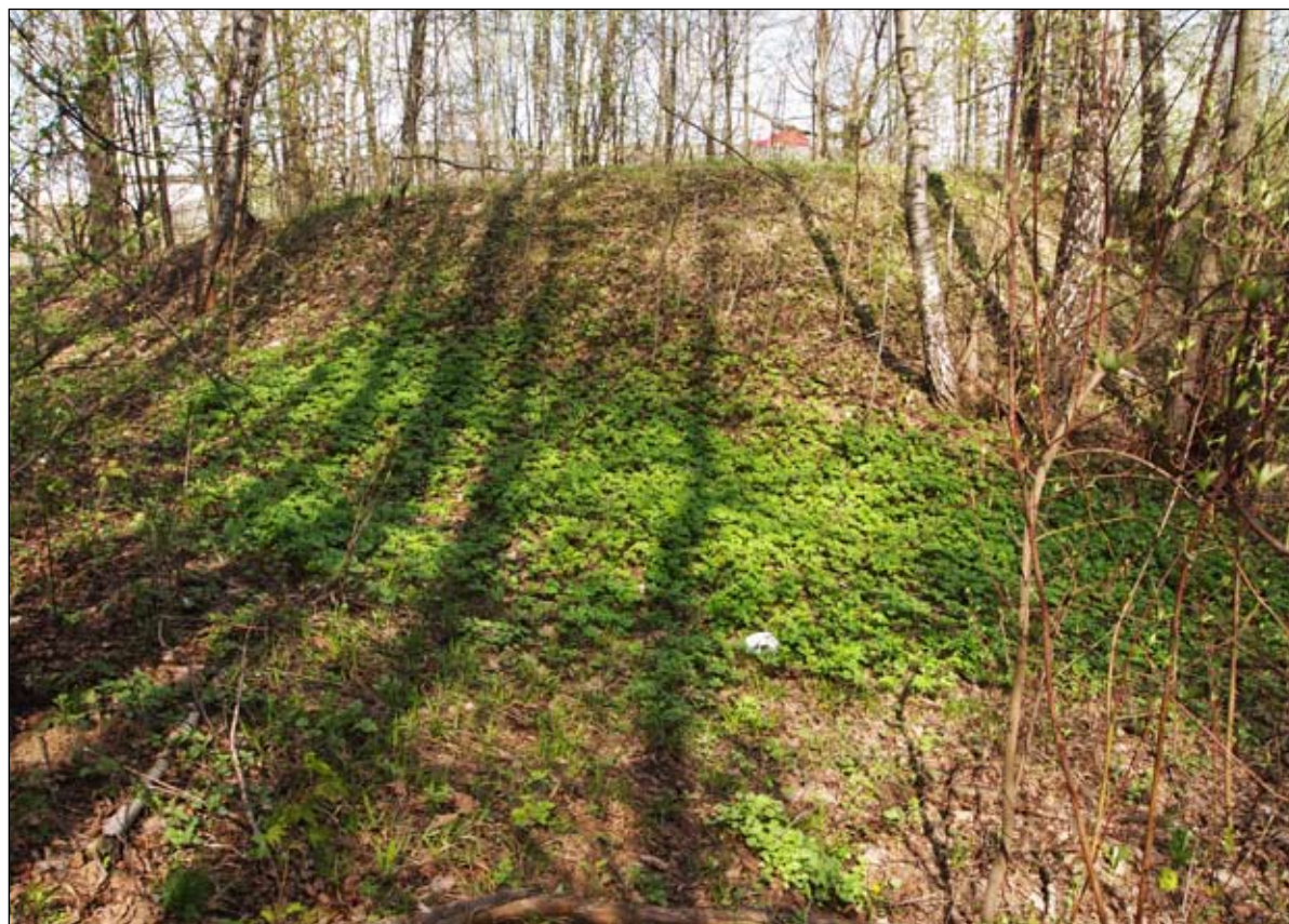
Холм указывает на возможное место беседки или павильона