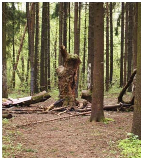
Погибший двухсотлетний дуб

Автор предположил, что усадьба находилась на правом берегу ручья, где при аэрофотосъемке просматривался ельник, явно появившийся позднее. На правому же берегу близ верхнего пруда — бывшая поляна, засаженная средневозрастным ельником. К ней ведет дорога, засаженная средневозрастным вязовником. В центре (среди ельника) был найден погибший дуб-солитер (отдельно стоящий) — ему более двухсот лет! Подобные дубы любили выращивать близ барских домов. Ельник граничит со средневозрастным березняком, а на самой границе — старые дубы и порослевые липы. У наиболее крупной — 7 стволов.