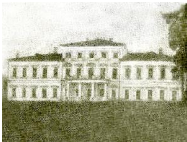
Господский дом (северный фасад). Фото 1930-х гг.

В Троицкое к Ф.И.Тютчеву М.П.Погодин тогда уже не ездил, поскольку тот сразу после окончания Московского университета оказался прикомандирован к российской миссии в Мюнхене сверх штата и только в июне 1825 года ненадолго вернулся в Москву в отпуск. Только к тому времени относится единственное документально известное посещение Ф.И.Тютчевым Знаменского, которое М.П.Погодин описал следующим образом: «Увидел Тютчева, приехавш[его] из чуж[их] краев; говор[ил] с ним об иностран[ной] литературе, о политике, образе жизни тамош[ней] и пр. Мечет словами, хотя и видно, что он там не слишк[ом] мн[ого] занимался делом; он пахнет двором. - Отпустил мне много острот. В России канцелярия и казармы. - Все движется вокруг кнута и чина. - Мы знали афишку, но не знали действия и т.п. [...] Смотрел на маленькое кокетство [княгини] Ал[ександры] Ник[олаевны] Голицыной, урожденной Левашовой, которой, как говорит, не нравится Тютчев, но она говорит с ним беспрестанно и пр. Гов[орил] он об обществах; в Мюнхене общ[ество] малочисл[енное], - придворные и пр.» [37] .