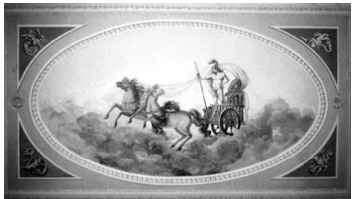
Марс на колеснице. Плафон Розового