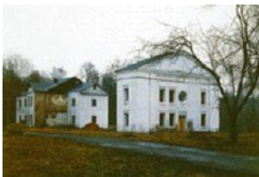
Оранжерея ("зимний сад")