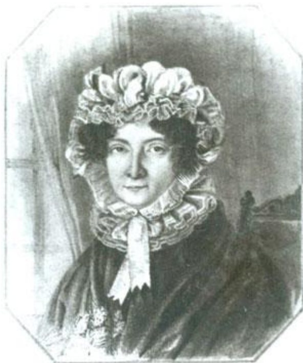
Неизвестный художник. Портрет Е.А.Трубецкой (?). 1820-е гг. ОР РГБ.

Достопримечательность широкой сосновой аллеи, соединявшей усадьбу с Серпуховской дорогой - прямоугольная смотровая площадка над береговым обрывом Битцы, откуда открывался великолепный вид на ближайшие окрестности, испорчена недавней установкой памятника воинам, якобы похороненным здесь в Отечественную войну 1812 года. Тогда в Знаменском не было никаких боевых действий, и, соответственно, павших в бою или умерших от ран. Отметим, что если таковые бы и были, то их место последнего упокоения находилось бы у одной из ближайших церквей: либо в Знаменском-Садках, либо в Киове-Качалове. Однако в церковных метриках, хранящихся в Центральном историческом архиве г. Москвы, нет записей о похоронах в 1812 году погибших солдат [26] .