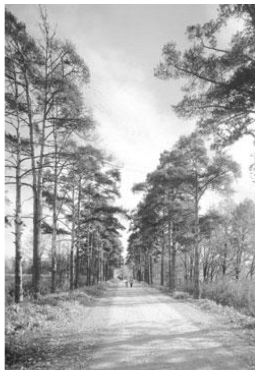
Подъездная аллея в Знаменское-Садки со стороны Старой Серпуховской дороги.

В значительной степени в доме сохранилась старая планировка и первоначальная декоративная отделка некоторых помещений. Типичен для зрелого классицизма двухсветный, хороших пропорций зал с хорами для музыкантов. Зал оформлен парными колоннами коринфского ордера, над антаблементом которых возвышаются украшенные акантами лепные кронштейны, как бы несущие живописный плафон перекрытия зала, поддуги которого расписаны под кессоны. В центральном овальном медальоне плафона изображена колесница бога войны Марса (в ряде изданий он ошибочно назван Аполлоном). Хотя искусствовед В.В.Антонов считал, что эту работу «из-за отсутствия документов и свидетельств современников можно пока с большой осторожностью отдать Джермано Скотти...» [19] итальянскому декоратору, позднее расписавшему интерьеры господского дома в Люблине, однако качество живописи не позволяет согласиться с этим предположением [20] .