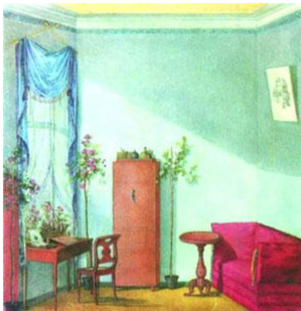
Интерьер будуара в Знаменском-Садках. 1820-е гг. ОР РГБ.