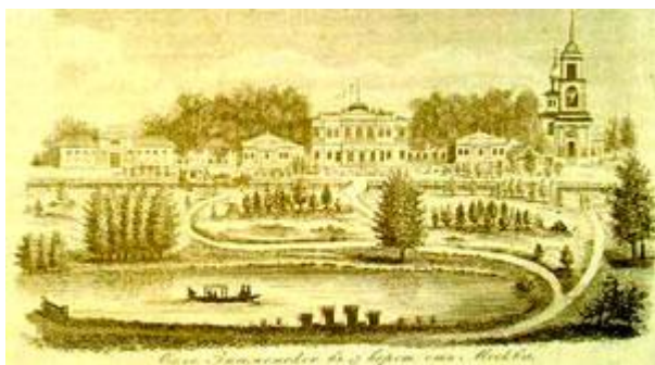
Неизвестный художник. "Село Знаменское в 17 верстах от Москвы". Нач. XIX в. ГЛМ (Усадьба Знаменское-

С начала 1970-х годов Институт вирусологии сменила Центральная лаборатория охраны природы Министерства сельского хозяйства СССР, со временем преобразованная во Всесоюзный научно-исследовательский институт охраны природы и заповедного дела (с 1993 года Всероссийский научно-исследовательский институт охраны природы). У входа в дом установлена мемориальная доска в память первого руководителя лаборатории - Л.К. Шапошникова.