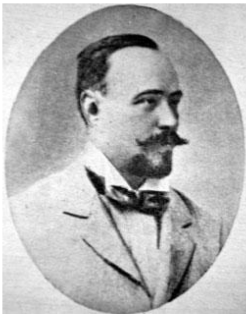
А.М.Катков. Фото кон. XIX-нач. XX в.

М.Н.Катков прожил в Знаменском до конца жизни, с годами все больше склоняясь к желанию отойти от политики и вернуться к любимому занятию юности - философии. 20 июля 1887 года после трехнедельной болезни он скончался в господском доме своей усадьбы. Тело М.Н.Каткова было перевезено в Москву и похоронено на территории Алексеевского монастыря (могила не сохранилась).