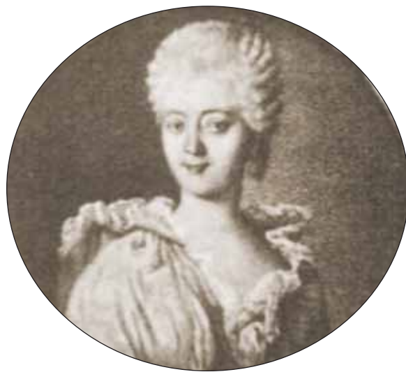
Неизвестный художник. Портрет В. И. Домашневой. Конец XVIII — начало XIX века

В 1790-х годах Малое Голубино принадлежало Варваре Ивановне Домашневой, урожденной княжне Оболенской (1764–1828). При ней крестьяне находились на барщине, а женщины занимались домашними рукоделиями 13 ; возможно, был сооружен новый каменный господский дом (на плане 1768 года его еще нет).