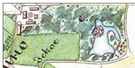
Малое Голубино. План 1861 года. Черной линией показана граница между господскими и крестьянскими землями. Вверху — укрупненный фрагмент плана, на котором показана территория усадьбы