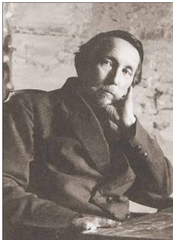
Аполлинарий Михайлович Васнецов. 1921 год

Видимо, упоминая А. М. Васнецовым аллея сейчас является северо-восточной