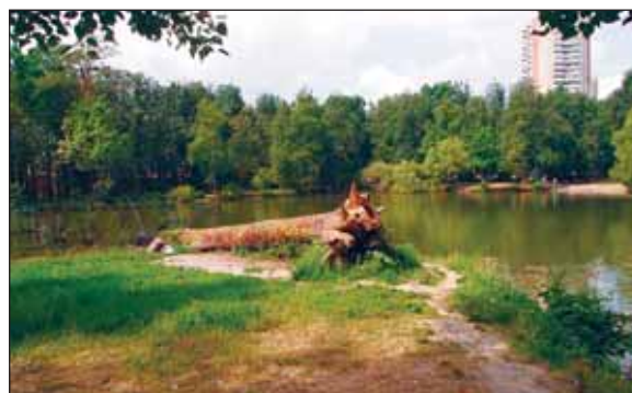
Парк усадьбы Малое Голубино. Современные фотографии автора