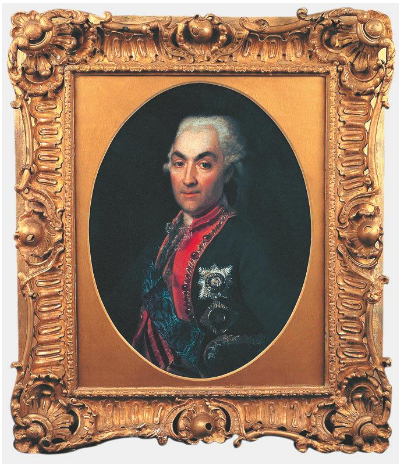
Портрет фельдмаршала князя Н. В. Репнина. Д.Г. Левицкий, 1792 г.