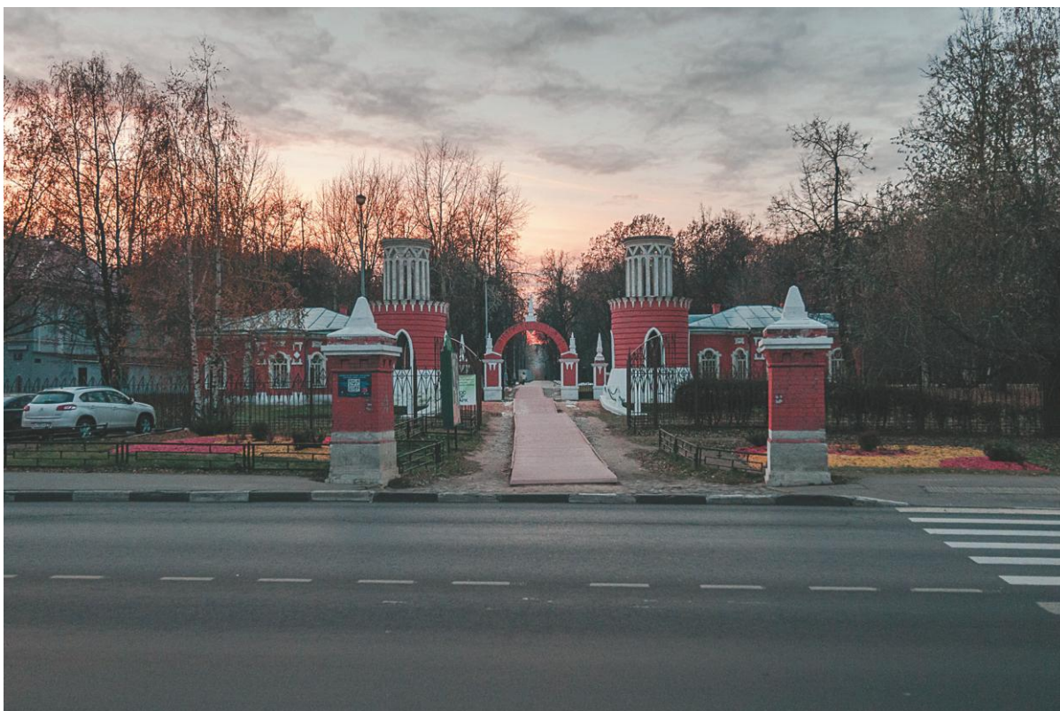
Вид на караульни и кордегардии со стороны ул. Архитектора Власова