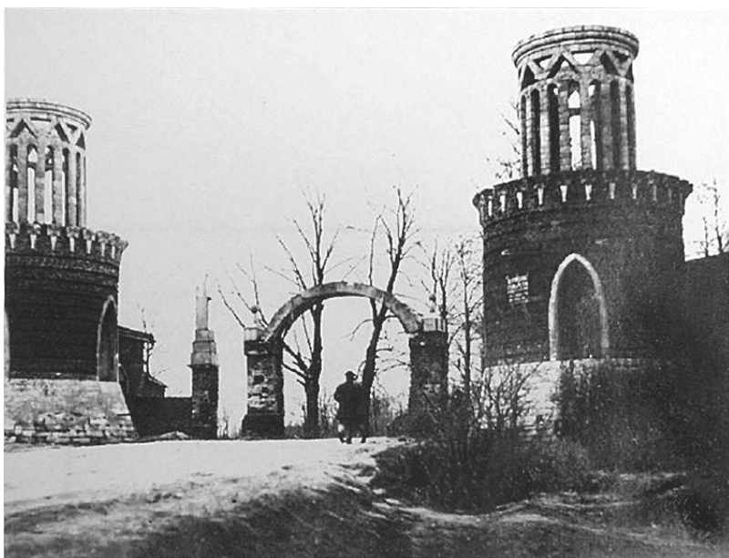
Ансамбль парадного въезда. Фото 1935 года

Подобные мемориально-триумфальные «турецкие крепости» сооружали в своих подмосковных усадьбах и другие отличившиеся военачальники. Наиболее известная из них Михалково графа П. И. Панина, чей ансамбль сохранился почти полностью. От крепостей в усадьбах Васильевское графа В. М. Долгорукова-Крымского (более известна по позднему названию Мамонова дача) и Троицкое-Кайнарджи графа П. А. Румянцева-Задунайского ничего не сохранилось. Как правило, такие сооружения имитировали реальные турецкие крепости, взятые под руководством этих полководцев, хотя, безусловно, не являлись их копиями, а сооружались по мотивам. Применительно к Воронцову это, безусловно, Мачин, за бой под которым в 1791 году Репнин получил орден Георгия 1-й степени – высшую военную награду страны. К сожалению, после смерти владельца значение ансамбля со временем было забыто, а снос одного из павильонов и превращение другого в церковь, а разрушение рва, вала и стен сильно обеднили его. В результате крепость воспринималась исследователями лишь как «парадный въезд».