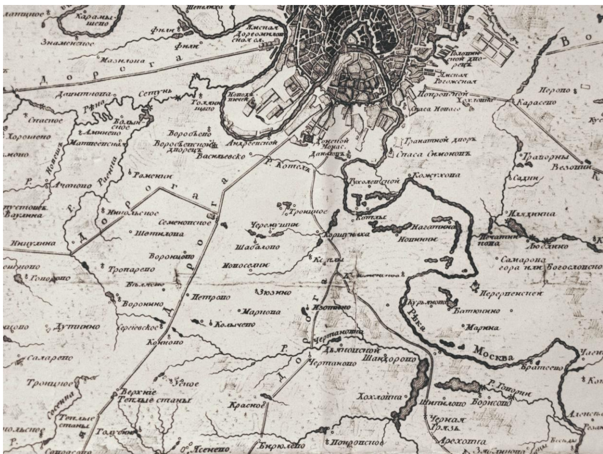
Фрагмент карты Москвы с окрестностями 1763 г.

Современная датировка рождения усадьбы, 1780-е годы, весьма приблизительная, так как никаких документов о его создании обнаружить не удалось. Кладка стен кордегардий отличается от кладки башен, что позволяет предположить, что ансамбль имеет два строительных периода, по времени расходящихся друг от друга. Очевидно, к третьему строительному периоду относится сооружение триумфальной арки с обелисками. По нашему мнению, все сооружения ансамбля относятся к 1790-м годам, периоду, когда Репнин жил в Воронцове и у него появилось время для строительных работ в усадьбе.