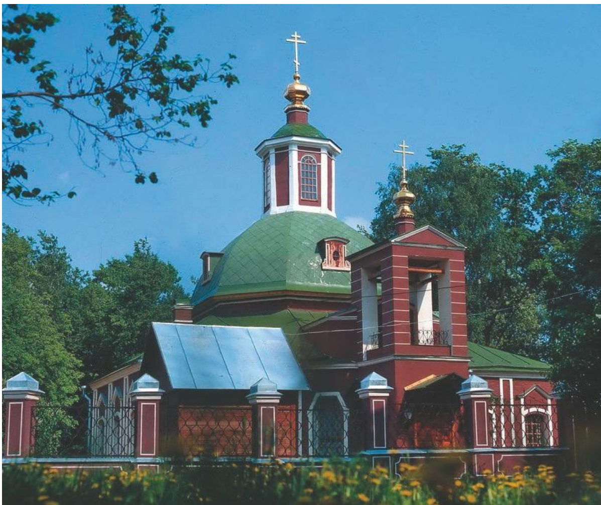
Церковь Троицы современное состояние