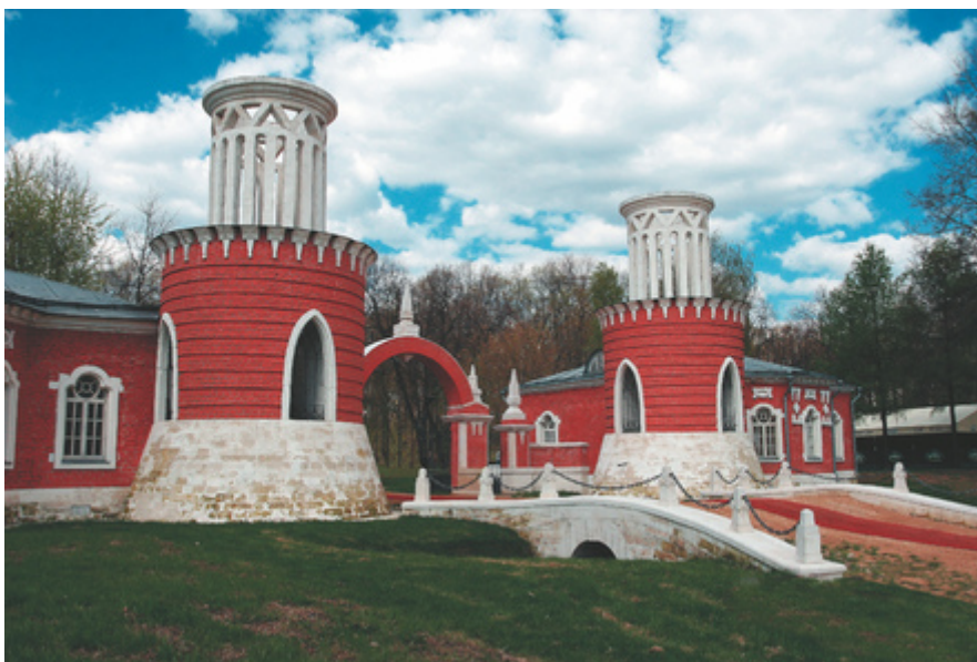
Парадный въезд усадьбы Воронцово. Кардигардии с башнями въездов и небольшой однопролетный мост

Удивительно гармоничные пропорции и готический облик ансамбля репининской усадьбы Воронцово позволяют увидеть в авторе их проекта незаурядного архитектора. Недаром разные исследователи приписывали его создание лучшим зодчим той эпохи, Баженову или Казакову. Они проектировали дворцы расположенного южнее Воронцова в царском имении Коньково-Троицкое, и, выезжая для работы из Москвы, не могли не миновать Воронцова. Иногда автором ансамбля в Воронцове считают Джакомо Кваренги.