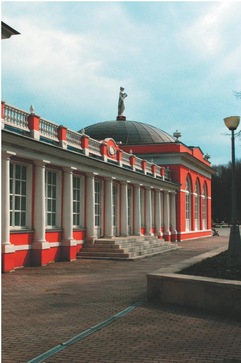
Северный корпус служб и оранжерея

Последняя реставрация башен и кордегардий была в 2006 году. Весь ансамбль парадного въезда и усадебные постройки были окрашены не в кирпично-красный, а в розовый цвет, придающий комплексу вид новодела. Тем не менее, даже в своём современном виде увеселительная «турецкая крепость» Воронцово производит неизгладимое впечатление. Остаётся лишь надеется, что исследования и археологические работы будут продолжены, возможно, удастся воссоздать усадьбу в первоначальном виде.