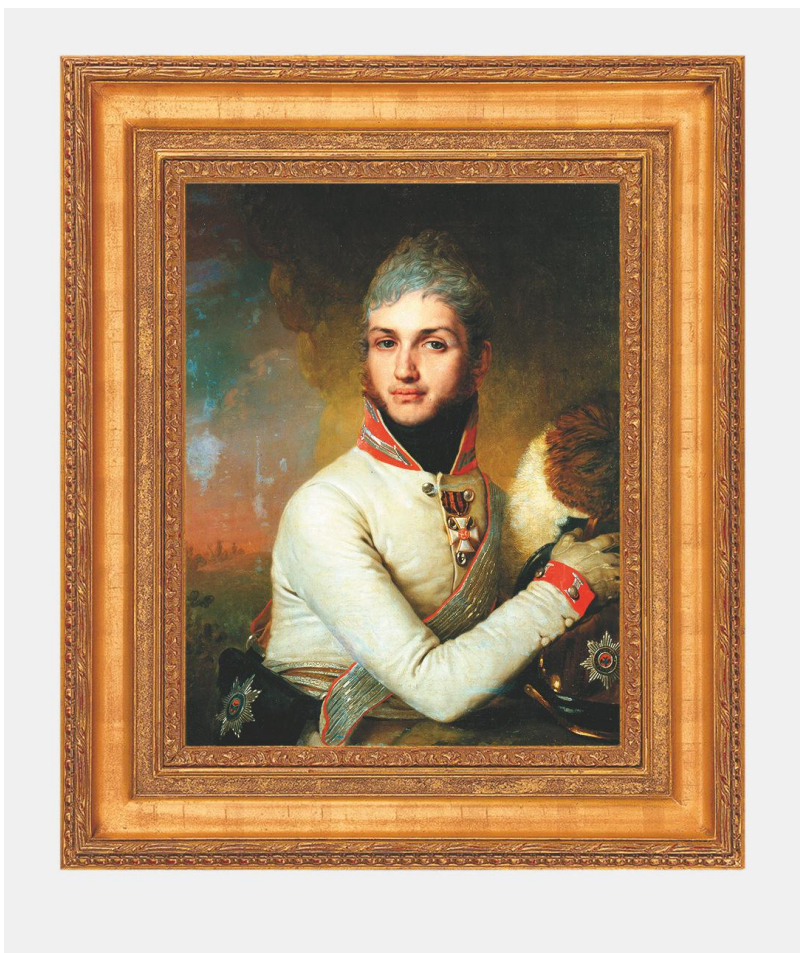
Портрет князя Н. Г. Репнина-Волконского. В.Л. Боровиковский, 1806 г.