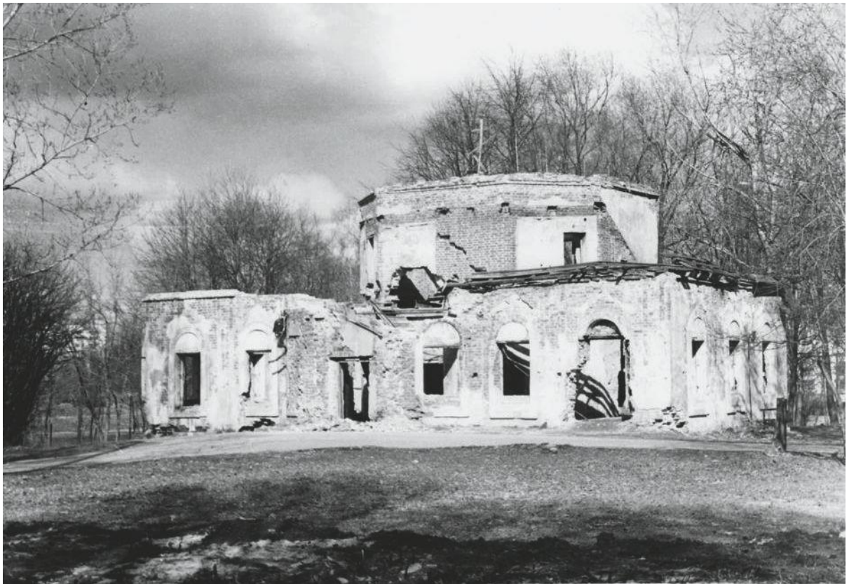
Церковь Троицы Живоначальной в Воронцове, 1990 г. На фото хорошо выявляется гражданская сущность первоначальной постройки